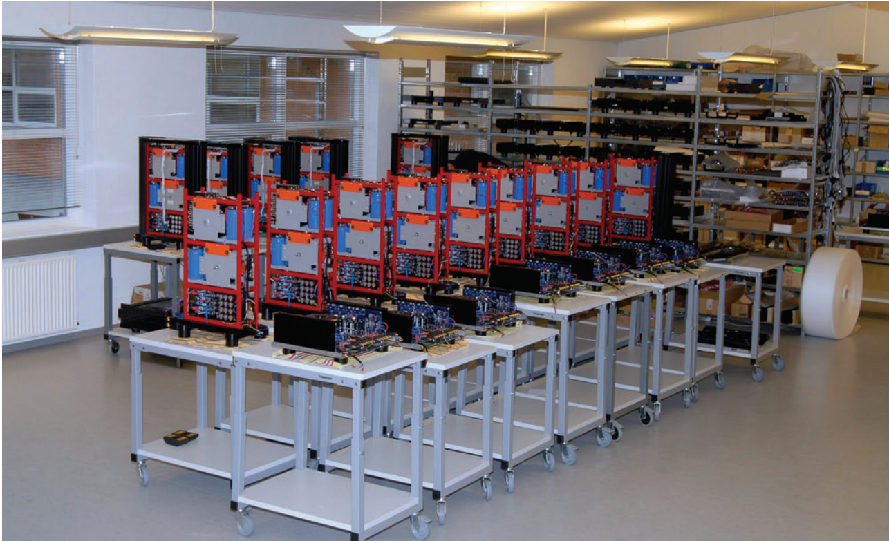
Blick in die Produktion

den Punkt da zu sein - alle Achtung! Auch die Trompete erstrahlt in vollem Glanz, ohne harsch oder nervig zu werden. Das hat enormes Suchtpotential.